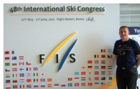
Prisotnih 70 držav