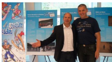
Plakat ŠPM in g. Marc Girardelli