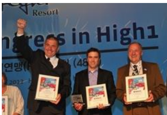
ŠPM na zmagovalnih stopničkah