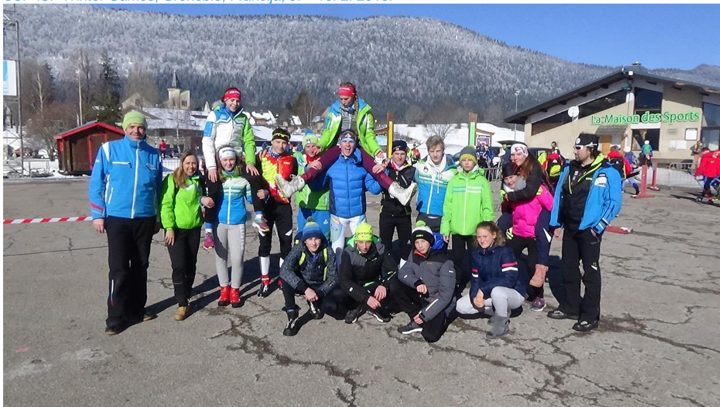
ŠSP ISF Winter Games, Grenoble, Francija, 5. – 10. 2. 2018: