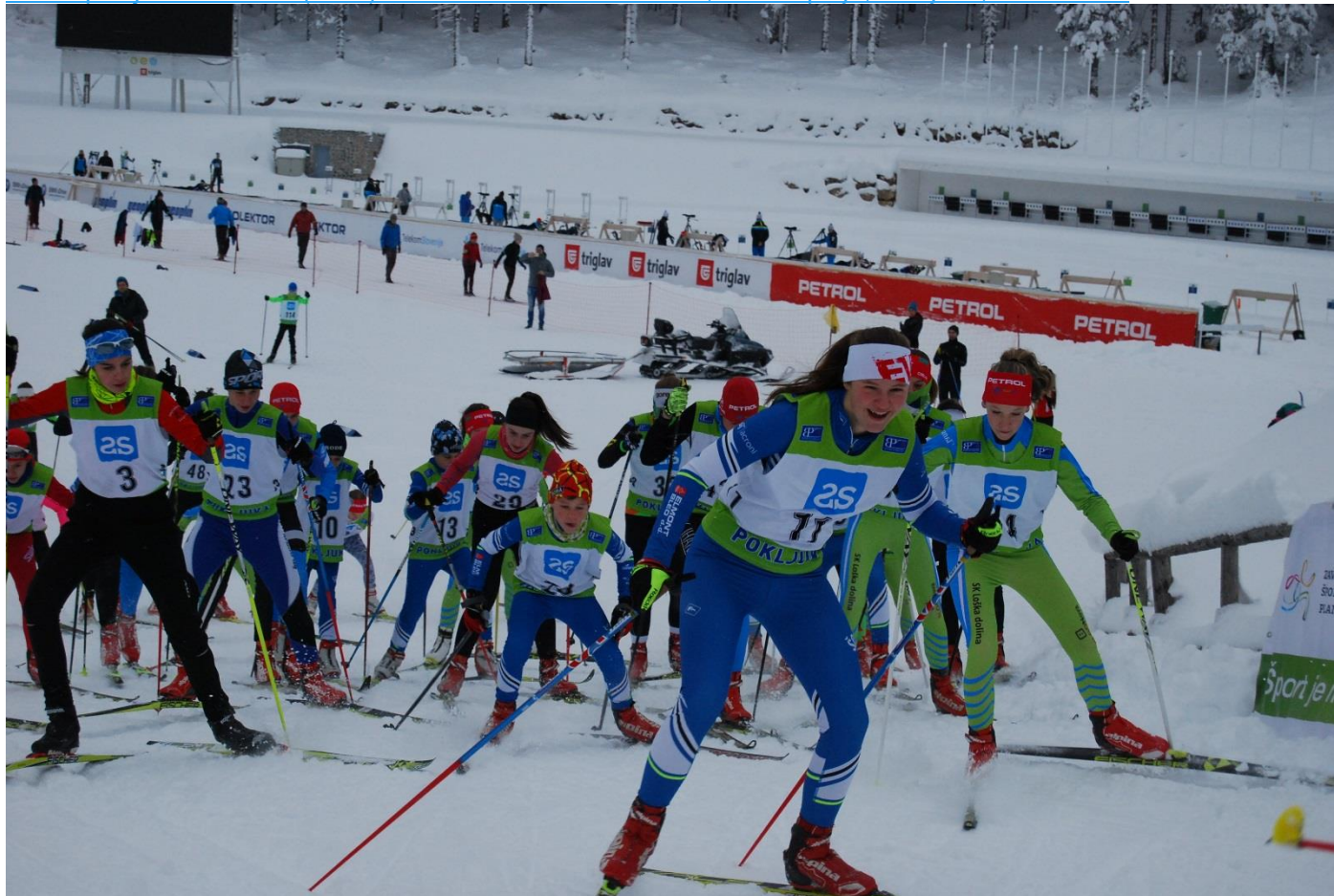
Zimske mednarodne otroške igre (ICG), Lake Placid, ZDA, 6. – 11. 1. 2019: