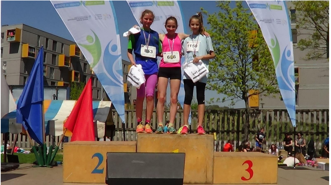
ŠDP v krosu, Maribor Tabor, 19. 4. 2018: