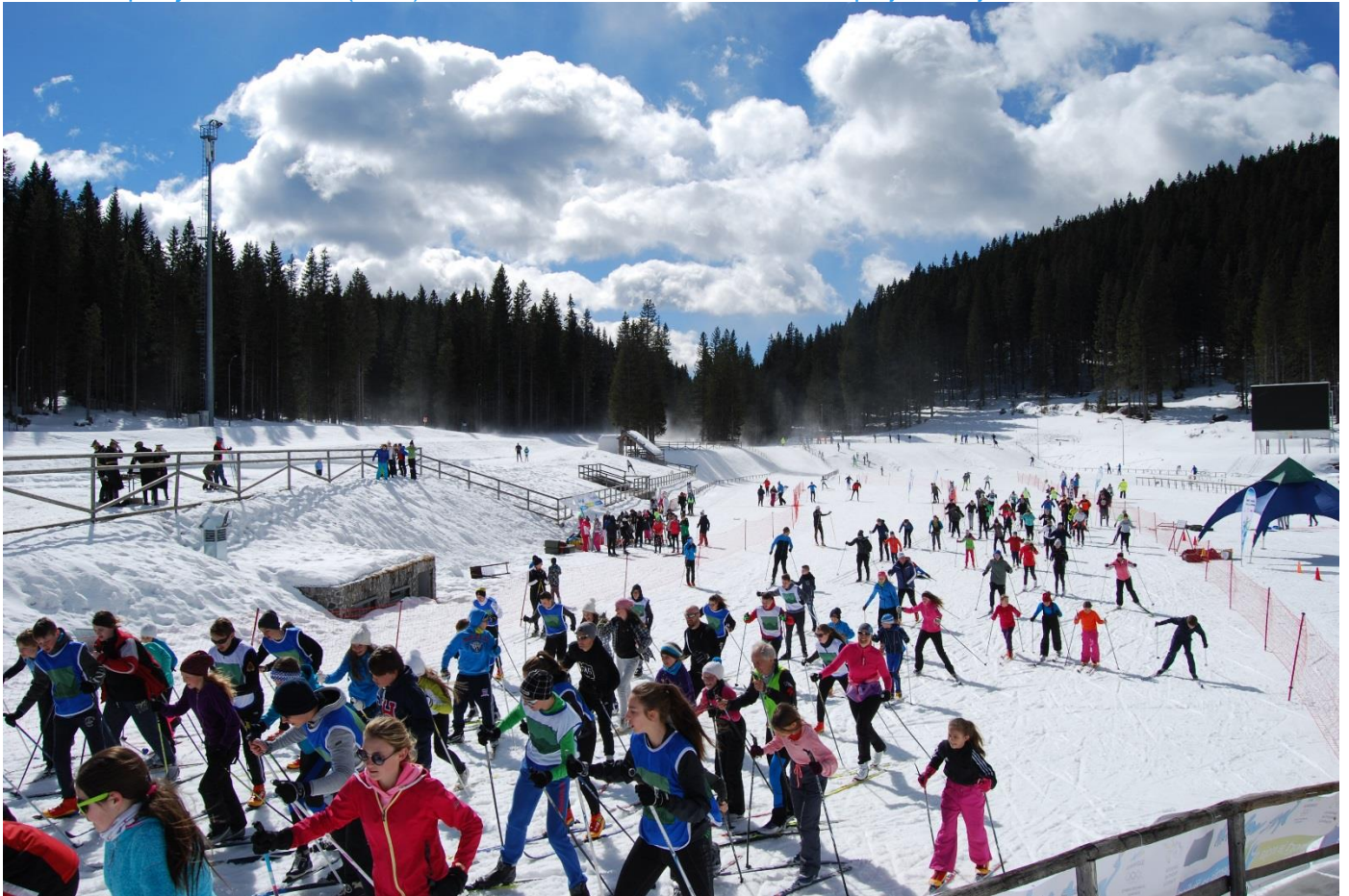
ŠDP v smučarskih skokih, Rogla, 9. 3. 2017 in ŠGP, Žiri, 21. 2. 2017: