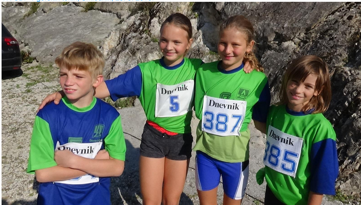
ŠGP ekipna atletika, Kranj, 21. 9. 2016: