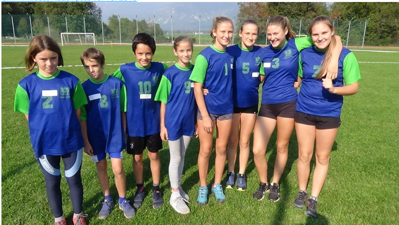
ŠGP v krosu, Kokrica pri Kranju, 9. 10. 2018: