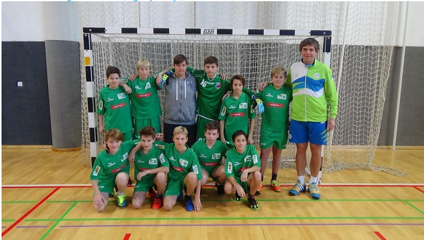
ŠGP Mladina in gore, Bled, 11. 11. 2017: