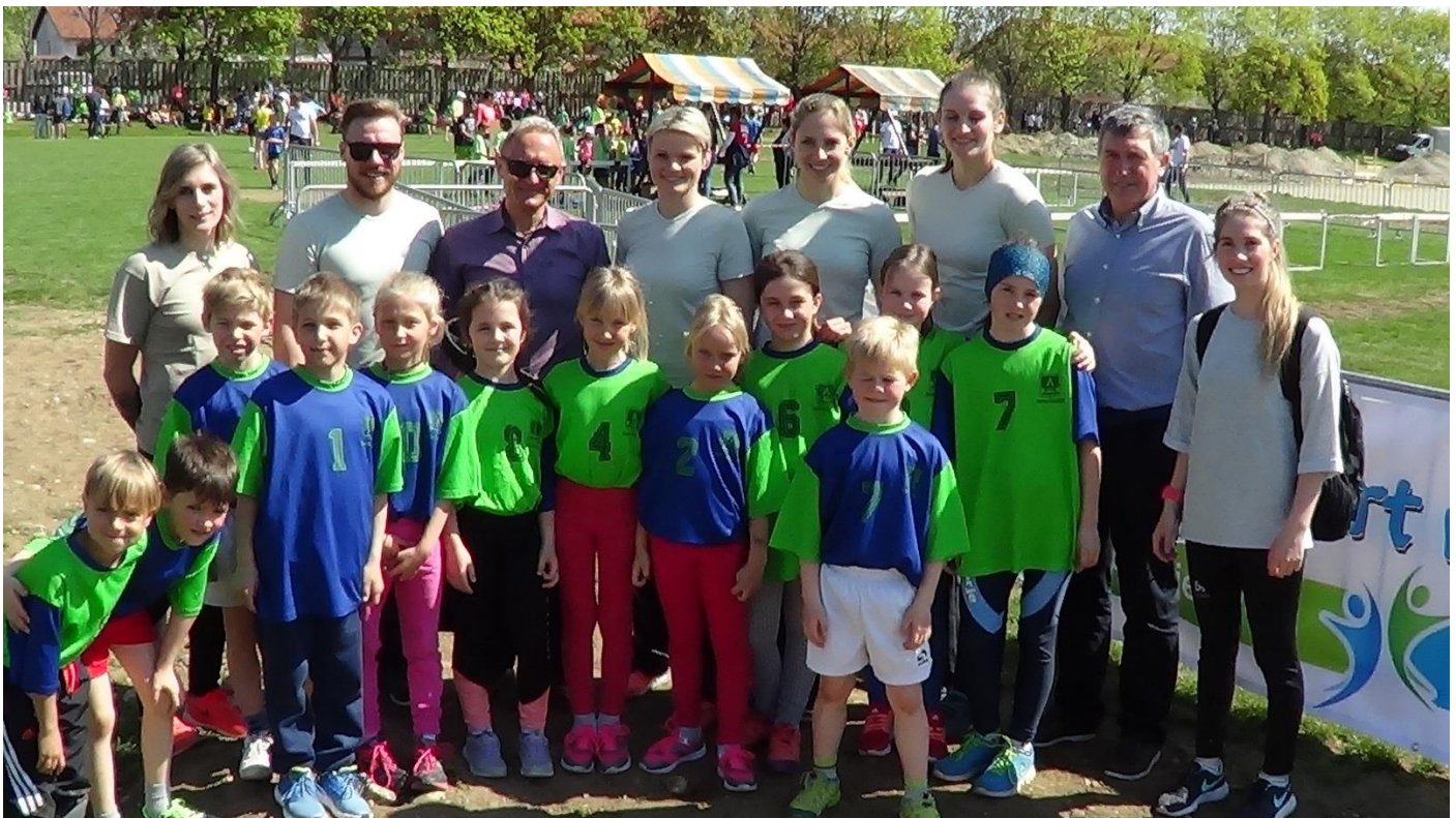
ŠDP v športnem plezanju, Vojnik, 14. 4. 2018: