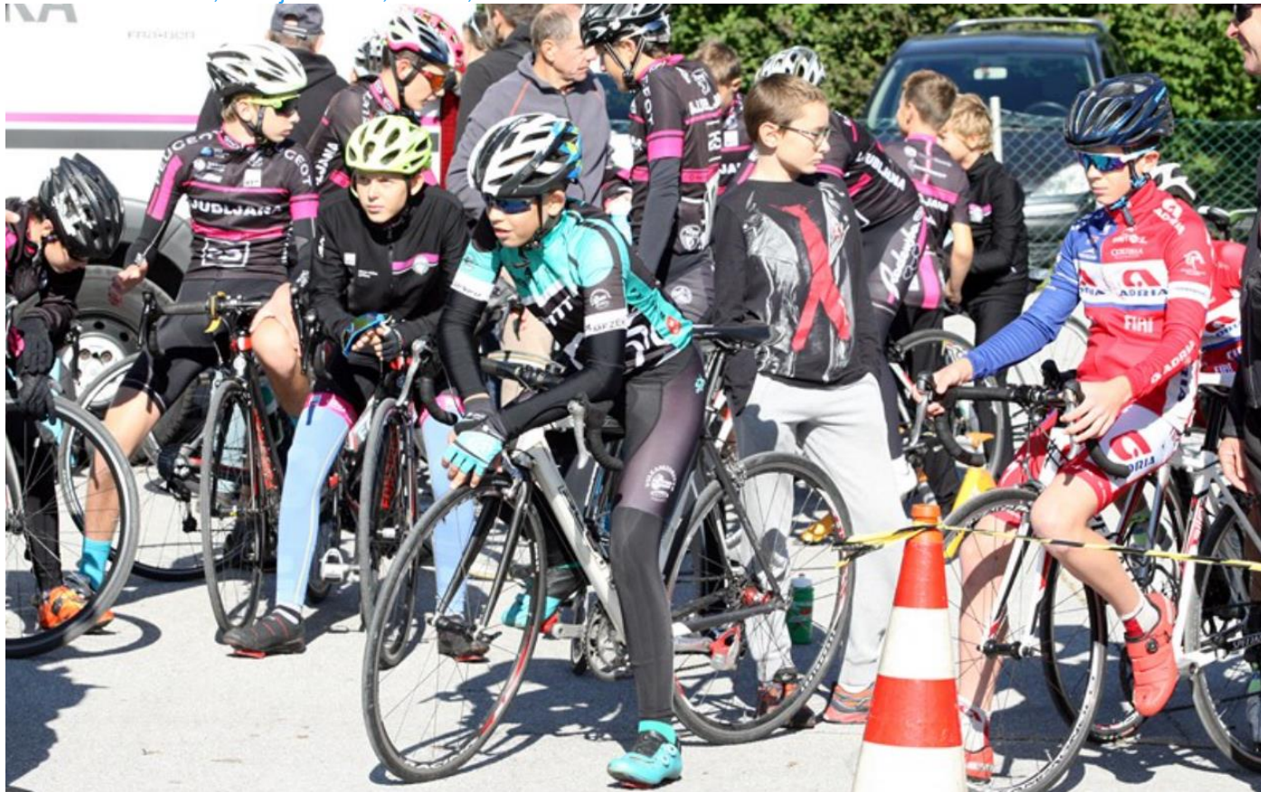
Poletne mednarodne otroške igre (ICG), Kaunas, Litva, 4. – 9. 7. 2017: