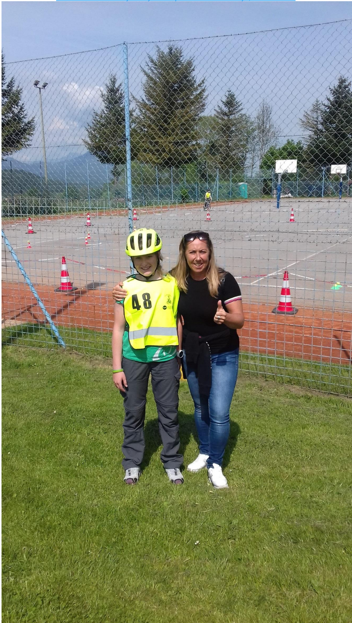
Državno tekmovanje: Kaj veš o prometu? – Mislinja, 25. 5. 2019: