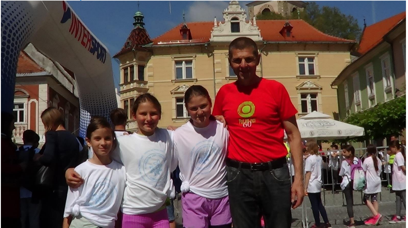
ŠMP v posamični atletiki, stadion Bled, četrtek, 11. 5. 2017: