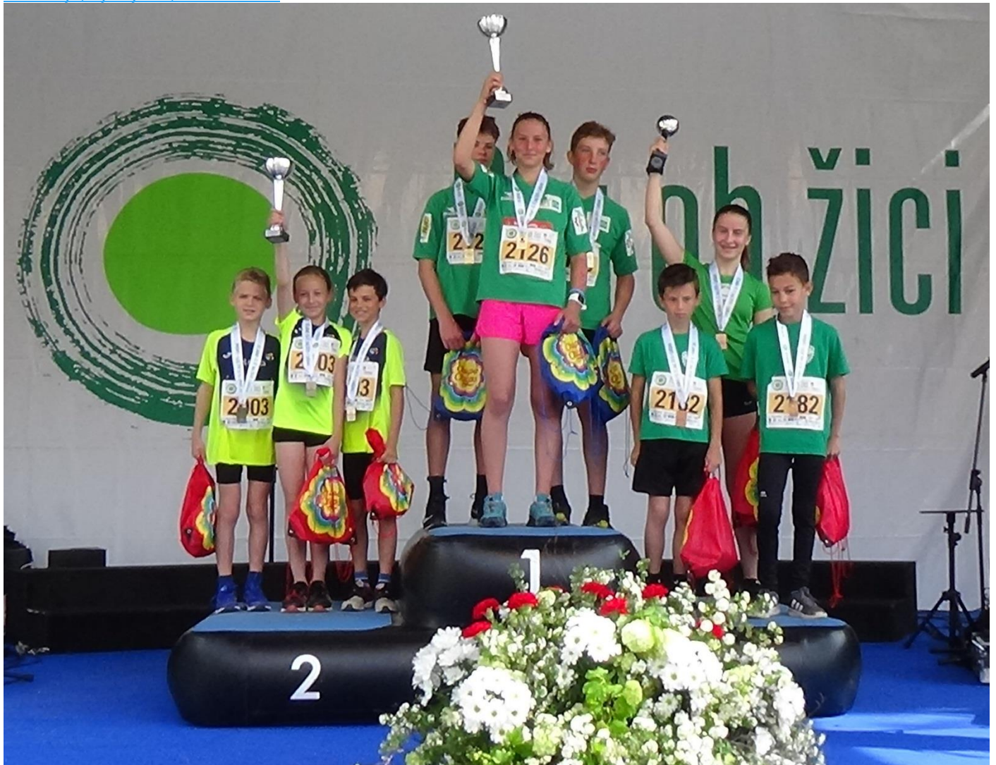
ŠMP v posamični atletiki, Bled, 10. 5. 2019: