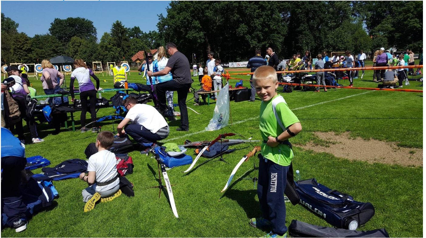
ŠMP v krosu, Radovljica, 13. 4. 2017: