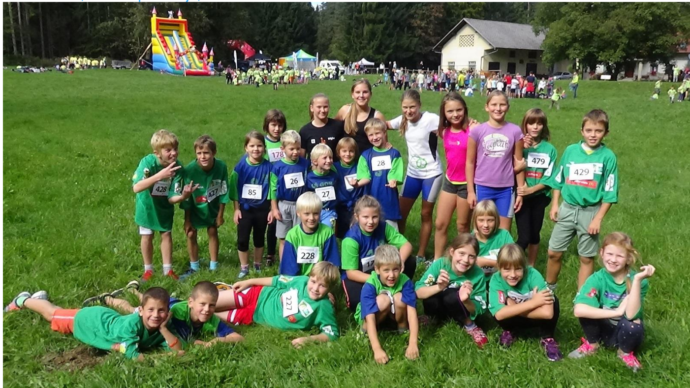
ŠDP v kolesarstvu, vožnja na čas, Tacen, 30. 9. 2016: