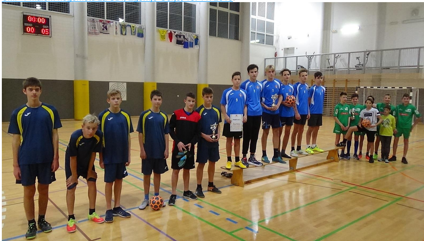
ŠGP Mladina in gore, Semič, 10. 11. 2018: