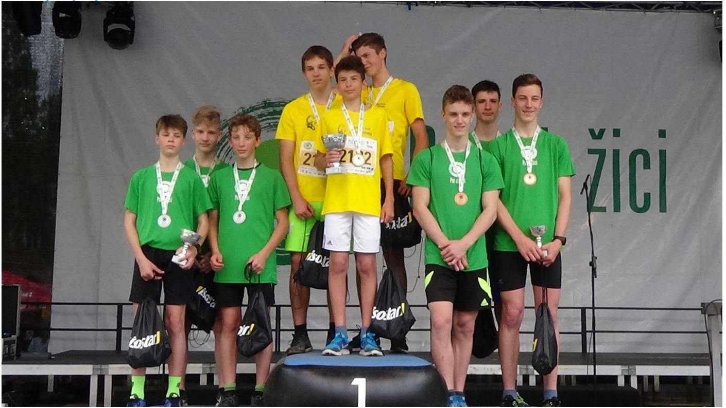
Pomladni kros Gorje, 28. 4. 2018: